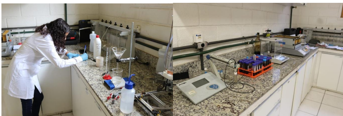
Figura 2: Laboratório do Escalab.