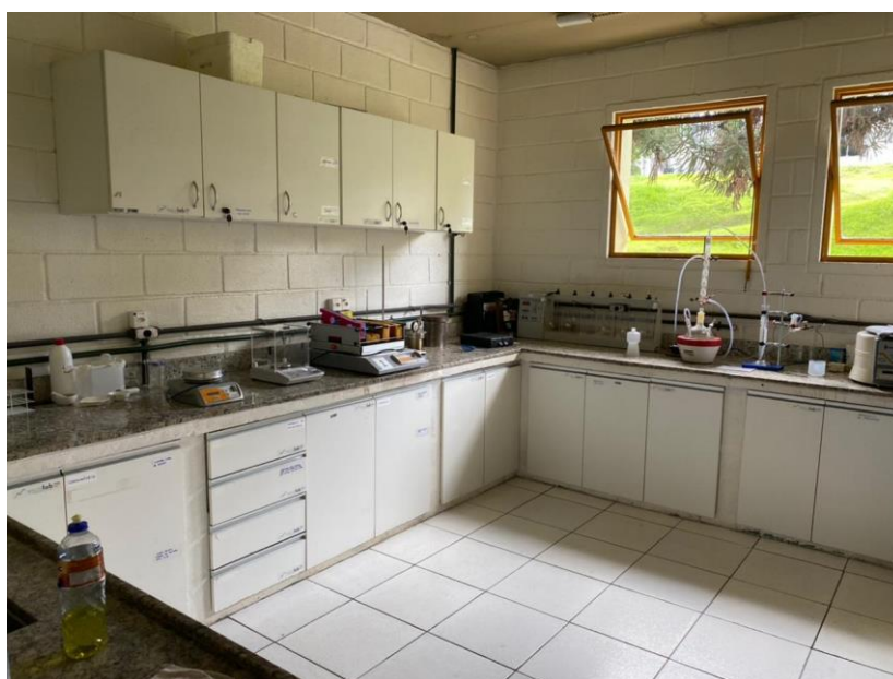
Figura 3: Visão ampla do laboratório.